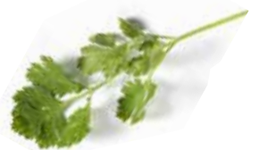
Ceviche de pescado